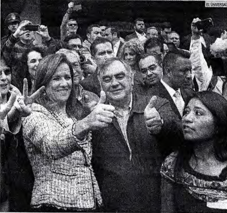
CIUDAD DE MÉXICO. Margarita Zavala tras registrarse como aspirante a candidata independiente a la Presidencia de la República.

DUARTE. El gobierno ha recuperado los recursos desviados en el sitio veracruz.gob.mx